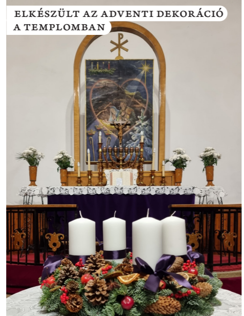
ELKÉSZÜLT AZ ADVENTI DEKORÁCIÓ A TEMPLOMBAN

megértette a protoevangélium lényegét. Isten az ő szeretetéből küldte el az asszony utódát, Jézust, hogy legyőzze a halát okozó ördögöt. Az istálló, mint helyszín, a jászol, mint fekhely a szegénységet jelzi, azt a lemondást, amit Isten Fia vállalt értünk. Nem is tudjuk mi leírni azt az „életsvonalbeli” süllyedést, amit a mennyei szférából a földi világba való alászállás jelent. De azt is jelképezi a helyszín,