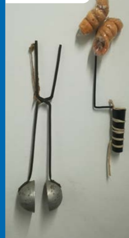
A „RURKA” ÉS A „BOMBA” SÜTŐFORMÁI

lisztet adagoljuk a jól gyúrhatóság eléréséig. Kis cipókba gömbölyítjük. Nyújtójával 2 mm vékonyra nyújtjuk, majd derelevágóval ujjnyi széles hosszú csikokra szeleteljük. A szeleteket a 4 ujjunkra tekerjük, a bombaformába tesszük, forró zsírba állítjuk. Ott tartjuk a formában, míg a tészta meg nem merevedett. Majd a formát kinyitjuk, újabb adagot teszünk bele. Ha a kis gömb megpirult, kiszedjük. Hűlés után bő porcukorba forgatjuk.