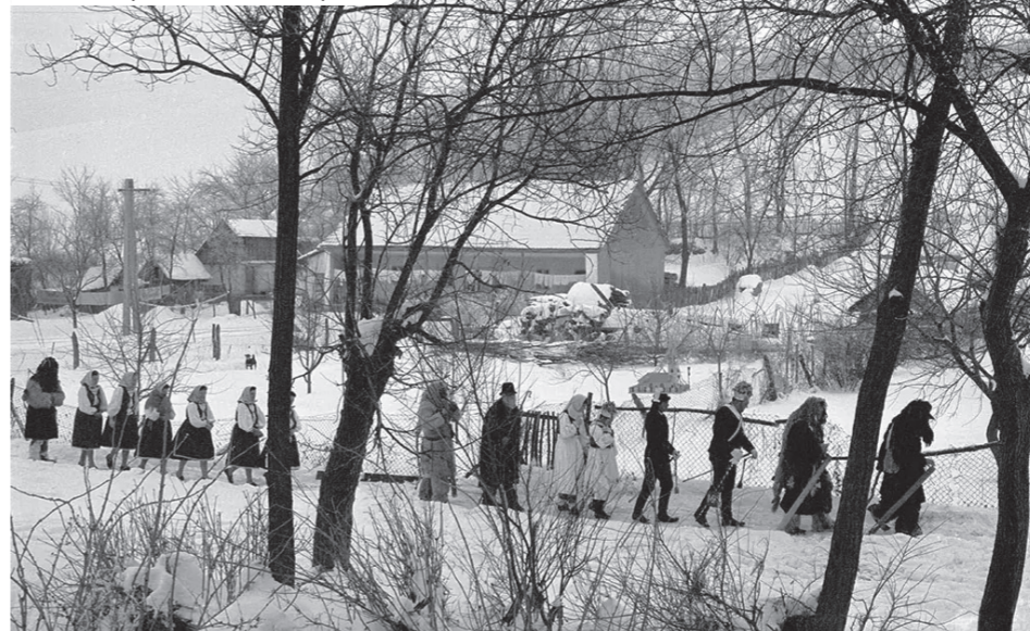
KAKASD, TOLNA MEGYE, 1973

Az első magyar szövegek a 17. századból erednek, s iskolai előadásokra készültek. Az utóbbi két évszázad paraszti betlehemezésének fontos része volt a kifordított bundát viselő betlehemi pásztorok párbeszédese, énekes-táncos játéka. A betlehemezők házilag készített, jászol vagy templom alakú betlehemet hordoznak magukkal, ez elmaradhatatlan kellék volt.