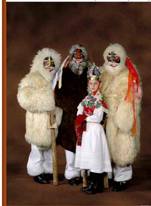
ANGYAL PÁSZTOROKKAL; KAKASD, 2005)