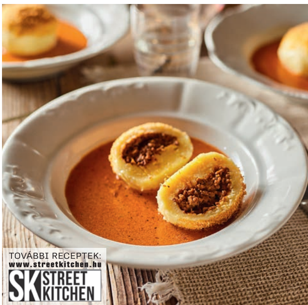
TOVÁBBI RECEPTEK: www.streetkitchen.hu SK STREET KITCHEN

Megfelezzük a tésztát és alaposan lisztetett deszkán kinyújtjuk úgy, hogy a