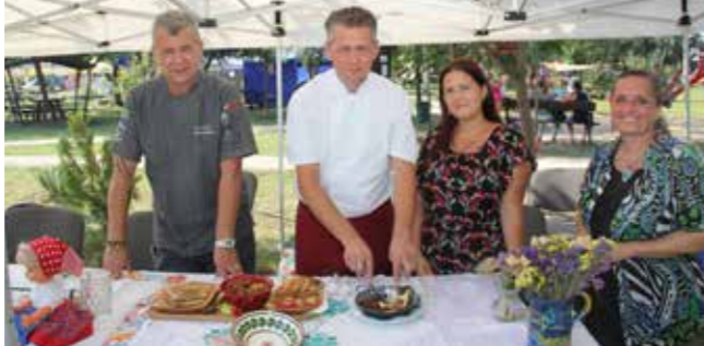
Munkában a zsűri

Király Étterem 40 000 Ft-os utalványában részesült.