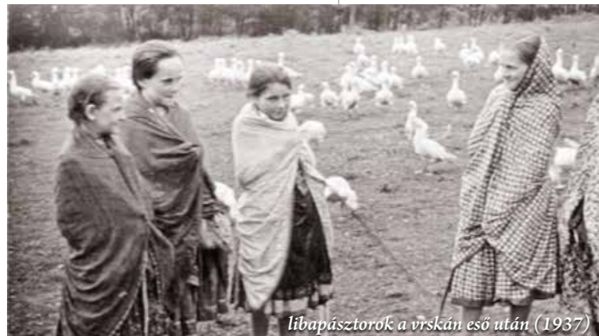
libapásztorok a vrskán eső után (1937)