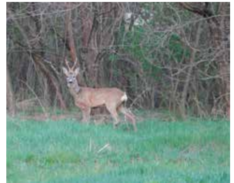
VARGA BOGLÁRKA Őzbak