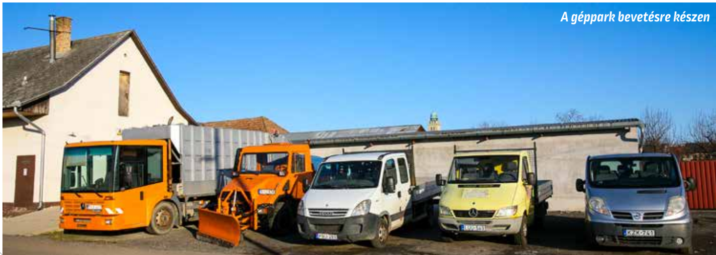
A géppark bevetésre készen