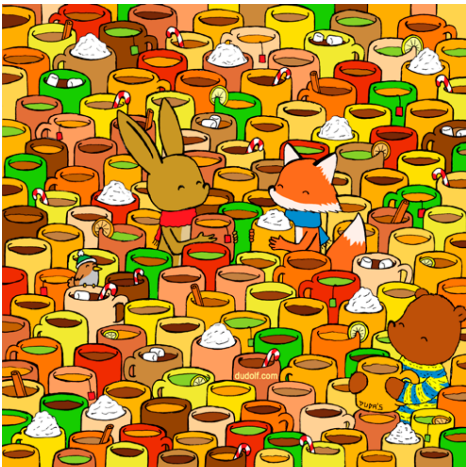
Valaki nagyon gyorsan megitta a kakóját. Megtalárod a kiürült bögrét?